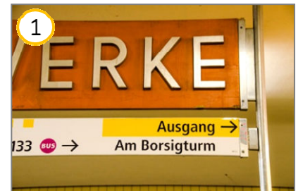
In der U-Bahn Richtung „Am Borsigturm“ gehen