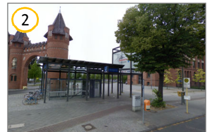
Gehen Sie rechts am Borsigturm vorbei in die Straße „Am Borsigturm“