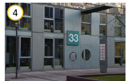
Hautschutzzentrum Berlin Am Borsigturm 33 • 13507 Berlin Tel. 030 / 81 00 60 90 www.hautschutzzentrum-berlin.de